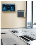
Pkw-Bremsenprüfstand BD 4182 Artikelnummer: 1 691 600 670