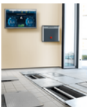
Pkw-Bremsenprüfstand BD 4482 Artikelnummer: 1 691 600 888