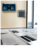
Pkw-Bremsenprüfstand BD 4132 Artikelnummer: 1 691 600 642