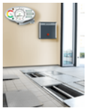
Pkw-Bremsenprüfstand BD 4332 Artikelnummer: 1 691 600 648